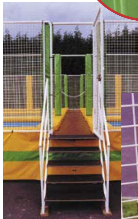
Escalier et passerelle centrale d'accès en bois contreplaqué marine