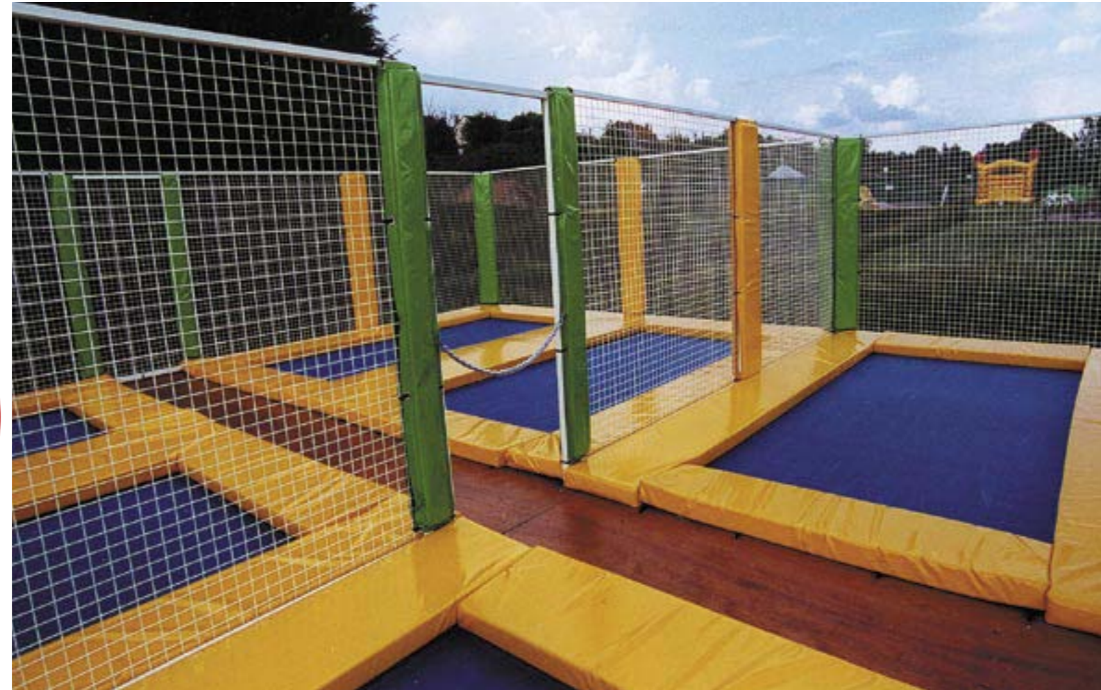
Jupe cache pied (couleurs au choix) Ossature grille métallique (anti vandalisme) ou filet au choix