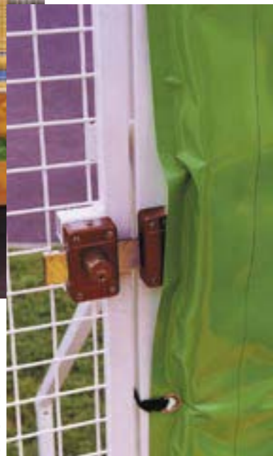
Verrouillage porte d'accès avec serrure